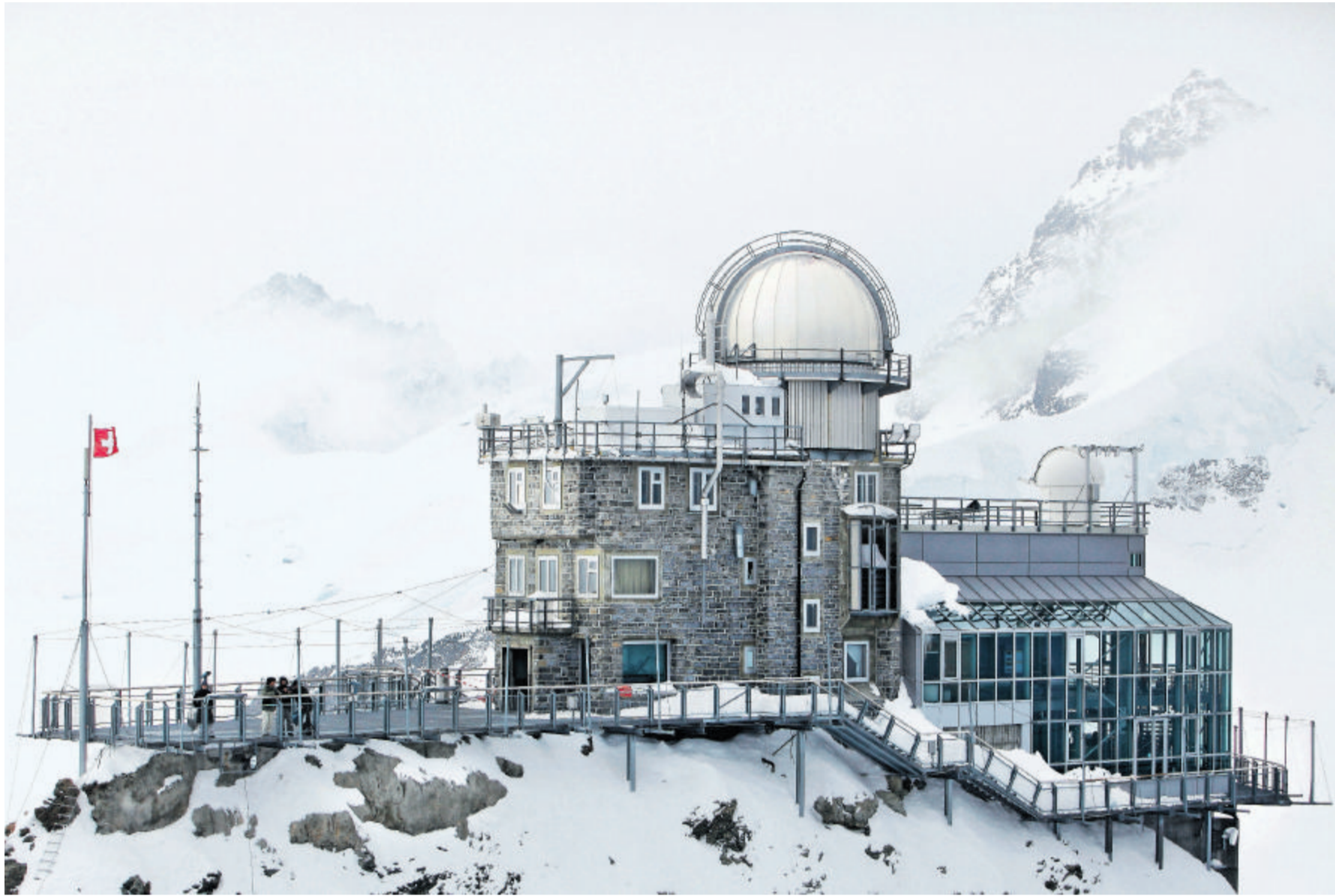
Die Empa führt rund um die Uhr Schadstoffmessungen in der Höhenluft der Forschungsstation Jungfrauoch durch.